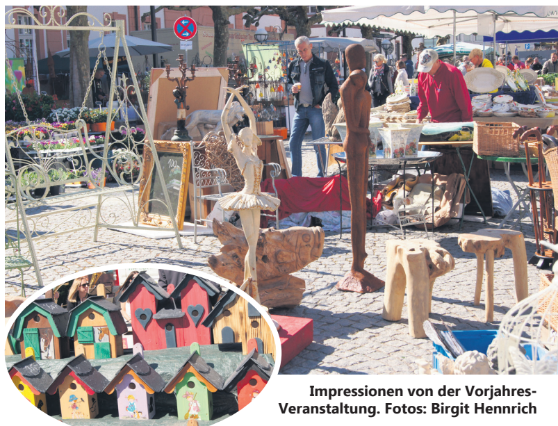
Impressionen von der Vorjahres-Veranstaltung.